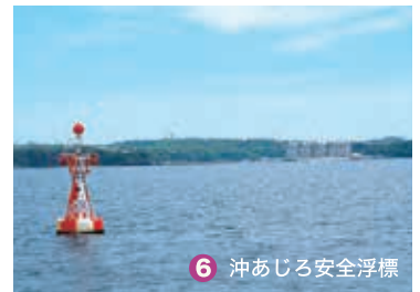
6 沖あじろ安全浮標

※ 「観音埼付近」は、特に手漕ぎボートが多いので、引き波をたてないように注意してください。