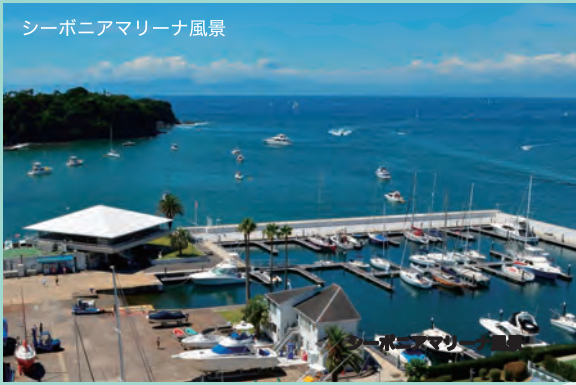
シーボニアマリーナ風景