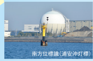
南方位標識(浦安沖灯標)

ニューポート江戸川 2F MARINA RESTAURANT TRIM 係留場所から徒歩約2分 ☎ 03-6808-5188