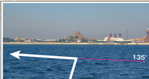
⑥この景色が、変針する目標・ポイントです。