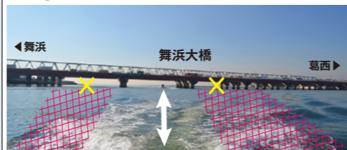
両端は浅瀬なので、川の中や橋では中央を通りましょう。