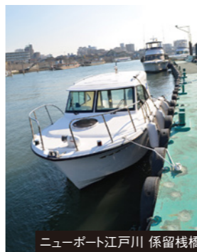
ニューポート江戸川 係留桟橋

[営業時間] 8:00～17:00 [定休日] 火曜日 ※無線なし 係留 利用料金 ○29ft以下…1,000円 ○30ft～…2,000円 ※レストラン利用者は2時間まで上記の料金となります。 ※40ft以上は係留不可 ※オーバーナイト不可 給油 ハイオクのみ ※アウトリガー搭載艇は、航行できない場所もありますので、事前にお問い合わせください。 陸電 なし 水道 あり 給油 OK