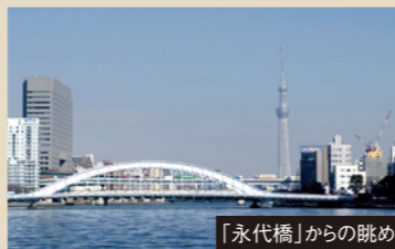
「永代橋」からの眺め