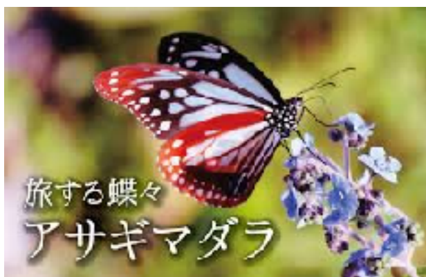
秋に飛来する蝶、見つけたらラッキーです