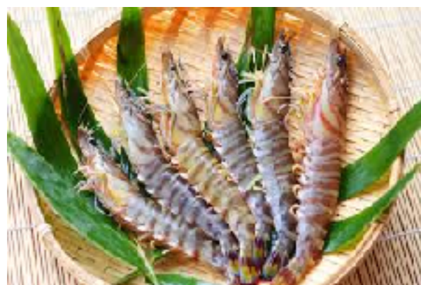
姫島の名産、天然の車海老は有名