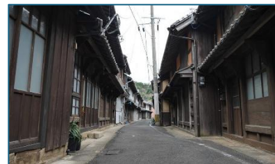
的山大島の街並み