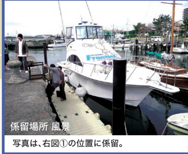
係留場所 風景 写真は、右図①の位置に係留。