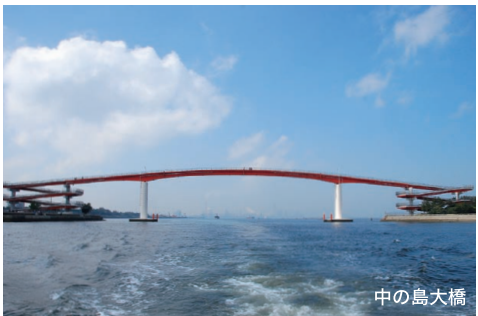
中の島大橋 海面から 27mもある、歩行者専用の橋です。 航路を通らないと、端は浅いので注意!