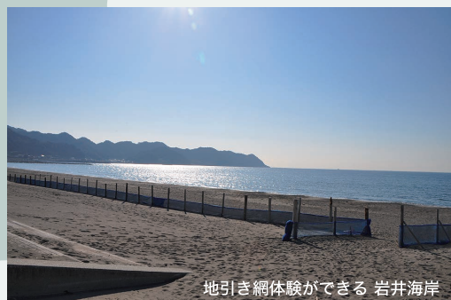
地引き網体験ができる 岩井海岸