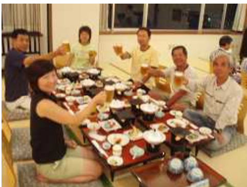
観潮荘でカンパイ