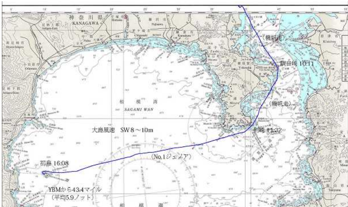
8月27日1日目航跡図(航跡図は箕輪作)

2泊3日の初島・三崎100マイルセーリングは8月27日~29日猛暑の中行われた。天気予報では太平洋高気圧が日本上空をすっぽり覆いかぶさるようにして居座っているため、27日~29日に掛けては晴れて安定した南風が吹く予報。強風でヨットが吹き倒される心配はない。トレーニングとしては絶好のコンディションである。