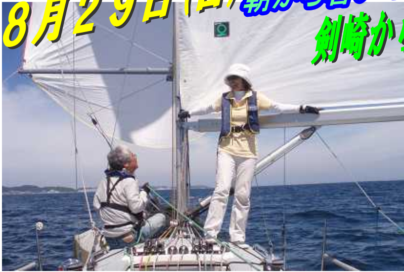
暑い暑いスピラン