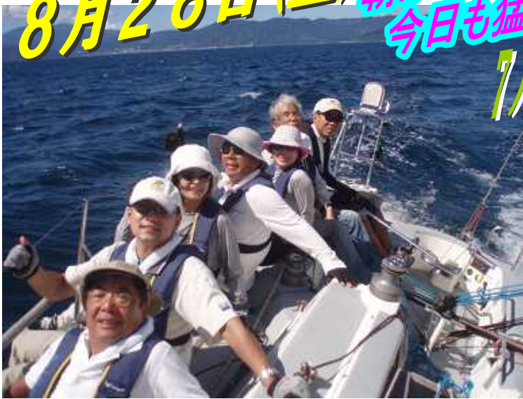
後方は伊東、ビームリーチで油壺へ