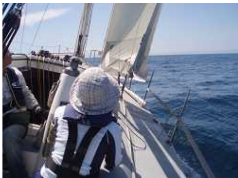
クローズリーチのトリムをする

1645民宿なかののライトバンで民宿へ。そして初島フィッシャリーナの温泉に出かけ1日の汗を流し落とす。最上階の露天風呂からは大島、三宅島、利島、新島、神津島まではっきり見えて感激する。冬でもこんなに良く見えないのに真夏で見えるとは、なんと幸運な人たちだろう。民宿なかのは初島で一番おいしい料理が出ることで知られている。サザエのつぼ焼き、サザエの刺身、魚の刺身、かさごの煮付け、明日葉てんぷら、海の幸を存分に味わった。