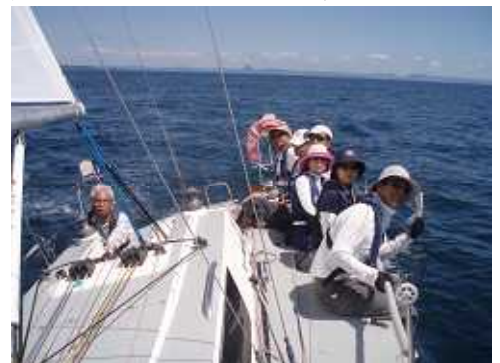
剣崎沖からセーリング開始