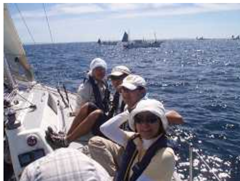
城ヶ島沖の漁船団を通過する