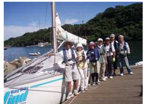
京急マリーナ出港前にパチリ