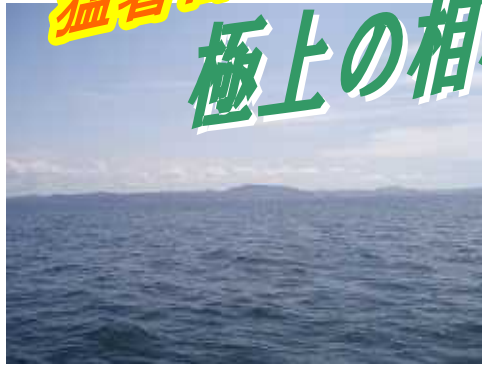
房総半島もくっきり見える