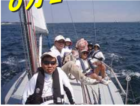
機帆走で剣崎に向かう