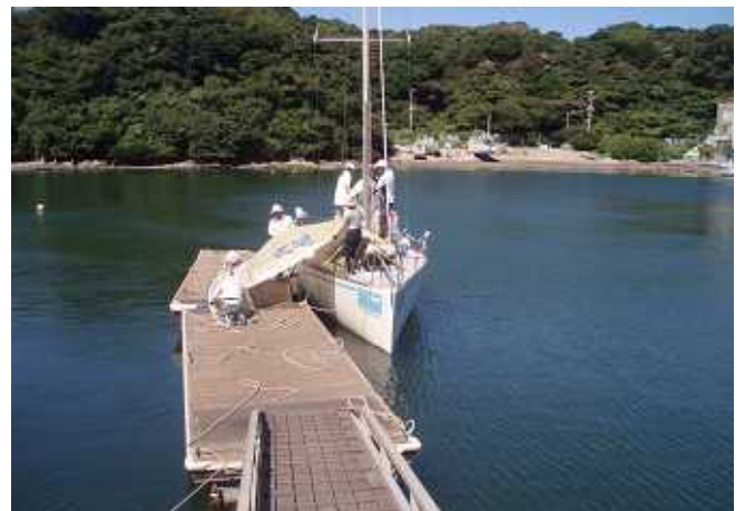
油壺京急マリーナにドッキング